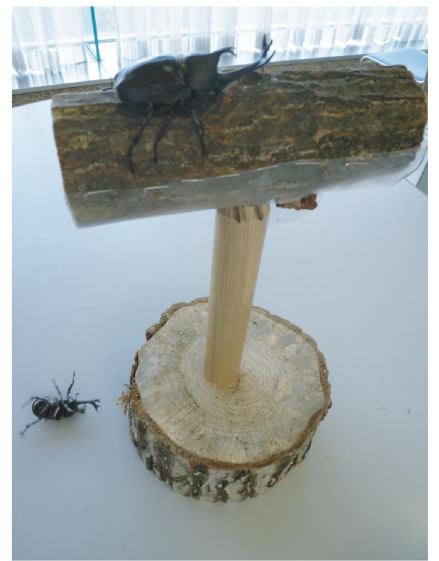
3. 相手を角ではじき飛ばしたり、土俵から押し出して落としたりしたら勝ち!