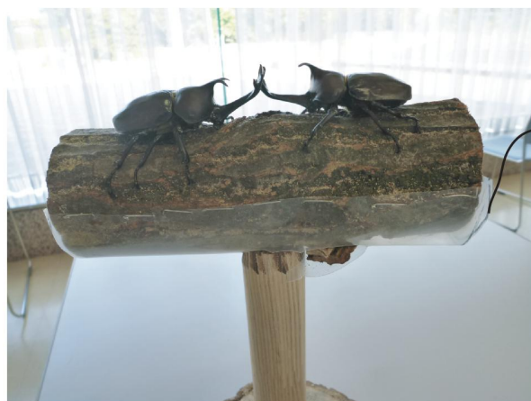
4. 土俵の下半分はツルツルしたプラスチックカバーが付いています。